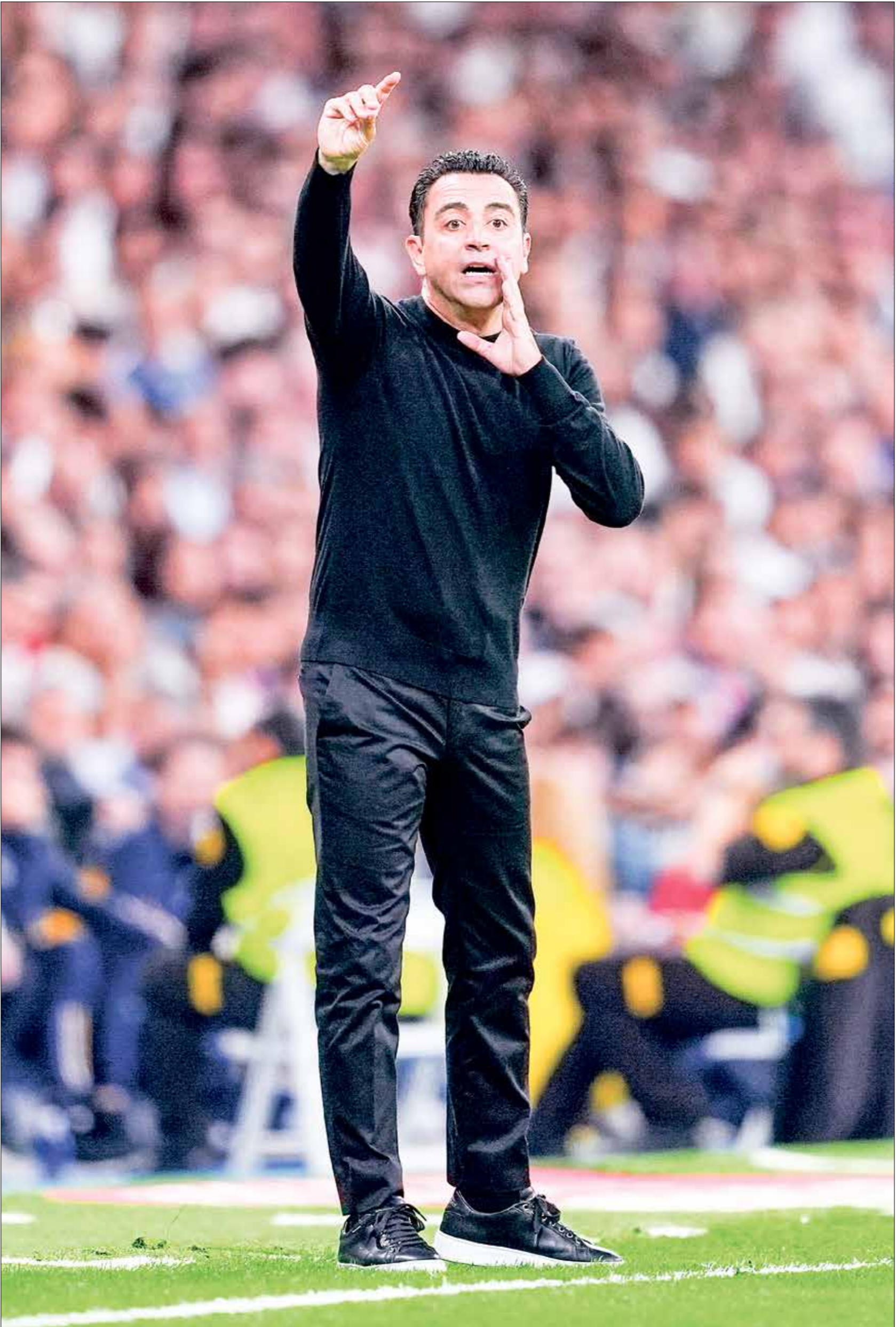
يواضع تشافي قيادة برشلونة