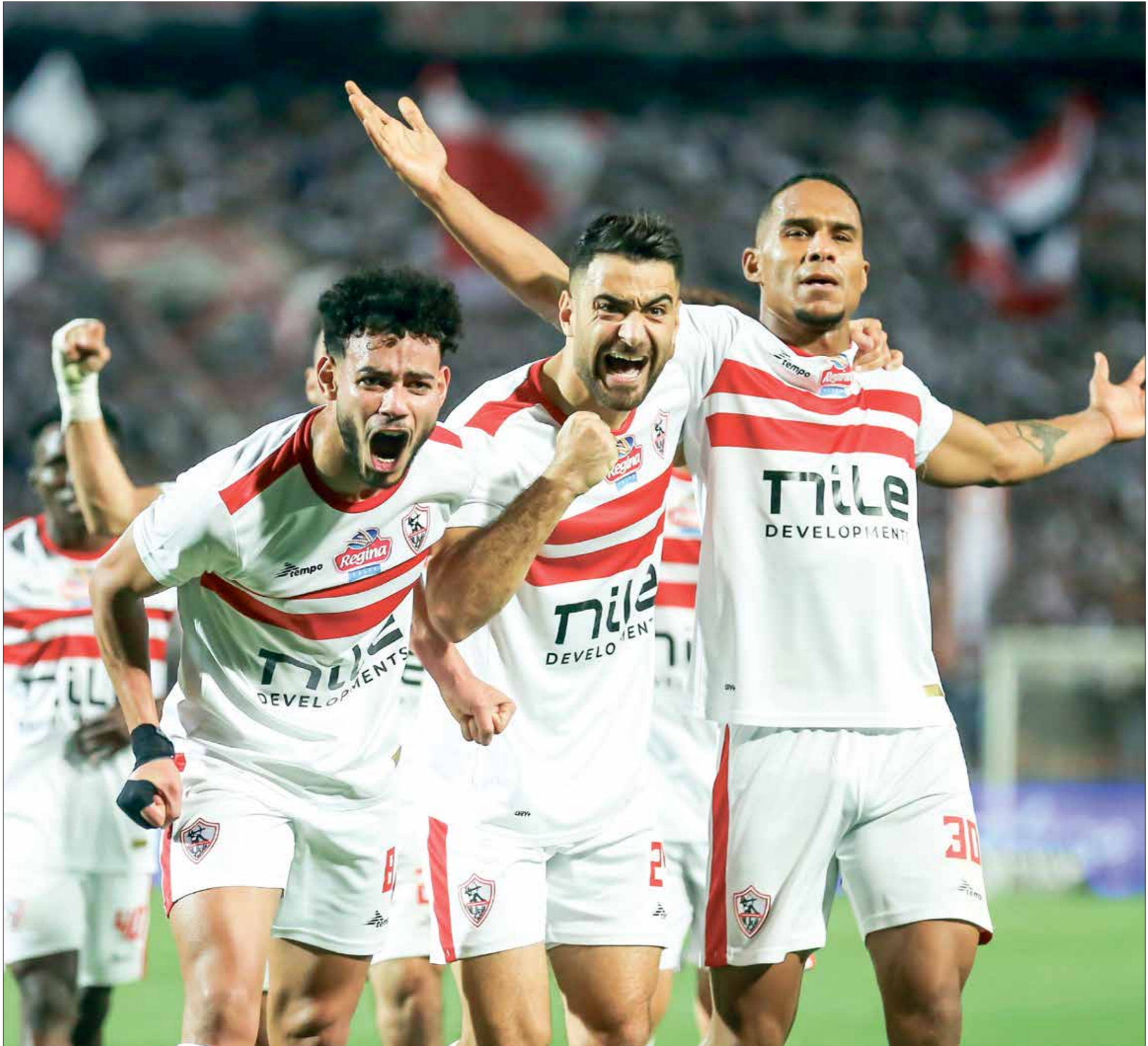
الزمالك يطمح بلوغ نهائي الكونفيدرالية

مباراة الإياب في الدور نصف النهائي من كأس الكونفيدرالية الأفريقية، التي تجمع بين نهضة بركان المغربي واتحاد العاصمة الجزائري. ولم تَقم مباراة الذهاب في الجزائر، رغم حضور الفريقين إلى أرض الملعب، بعدما رفض اتحاد العاصمة دخول نهضة بركان مرتدياً قمصاناً لجدل، دلالات سياسية وخريطة مثيرة للجدل، فيما تمسك نهضة بركان بموقفه، معتبراً الضخور إلى غانا قبل اللقاء بثلاثة أيام على الأقل للتأقلم على الطقس والتعود على درجات الحرارة».