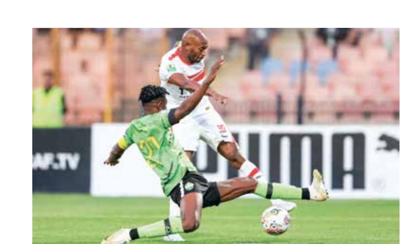
مواجهة منظرية بين المرفق المصري وديرمز

في الدور نصف النهائي وتقام مباراتنا الإياب من نصف نهائي كأس الكونفيدرالية الأفريقية، حينما يلتقي الزمالك المصري نظيره دريمز الغاني، مقابل ديربي عربي يجمع بين نهضة بركان المغربي واتحاد العاصمة الجزائري (حامل اللقب)، وهو