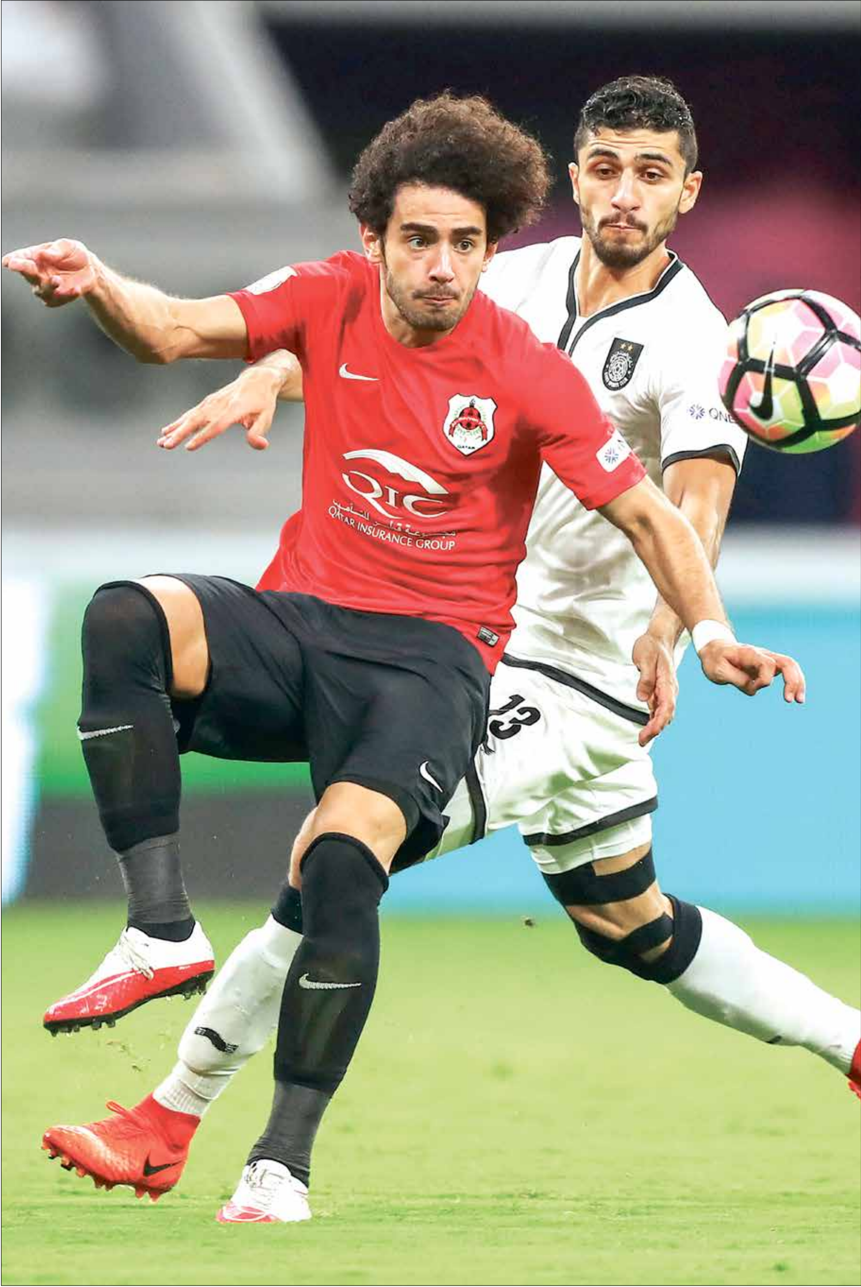
يريد الريان الفوز على السد في الكلاسيكو

يحلّ نادي السد ضيفاً ثقيلًا على الريان في كلاسيكو الكرة القطرية، اليوم الأحد، ضمن منافسات الجولة الأخيرة في دوري نجوم قطر. ويريد الريان الفوز على السد، بطل النسخة الحالية، لضمان مركزه الثاني في جدول الترتيب، حتى يبلغ التصفيات المؤهلة إلى دوري أبطال آسيا.